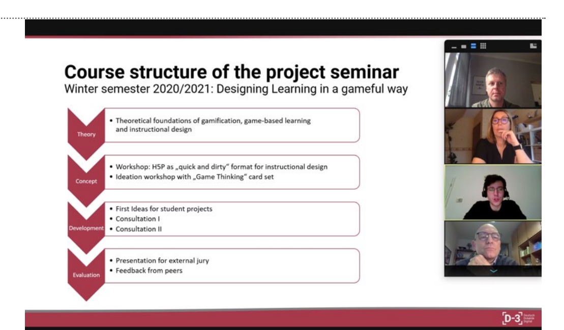
Konferenzteilnehmer*innen des Kick-off-Meetings in Halle folgen dem Vortrag über ein Seminar der Deutschdidaktik zum Game Based Learning Design