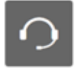
Live Expert Training