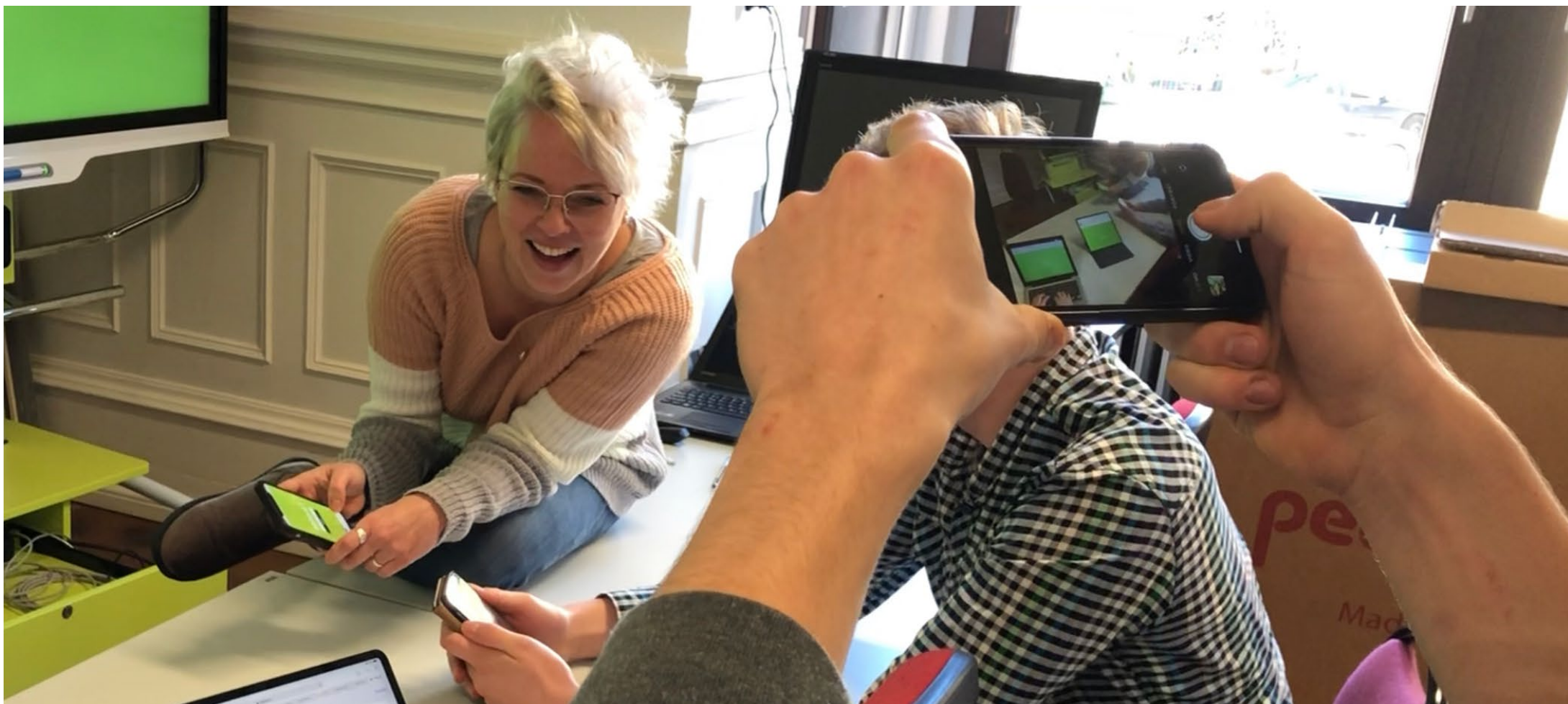
Handlungs- und produktionsorientierte Seminarformate schaffen gute Voraussetzungen für motiviertes, praxisorientiertes und soziales Lernen.

Leon Lukjantschuk | leon.lukjantschuk@zlb.uni-halle.de | dikola.uni-halle.de